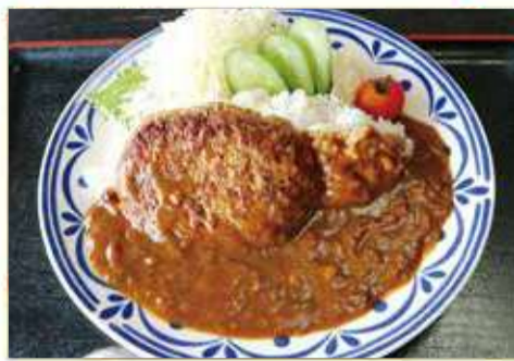
ハンバーグカレー 一七〇〇円 大盛り 一、九〇〇円