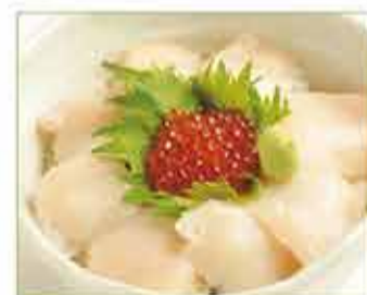
生ホタテ丼 一、六〇〇円