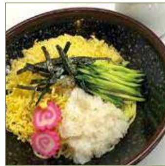
たぬきラーメン 九五〇円