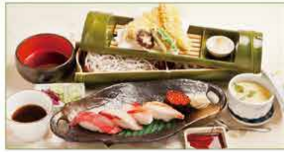
もてなし膳 二,二〇〇円