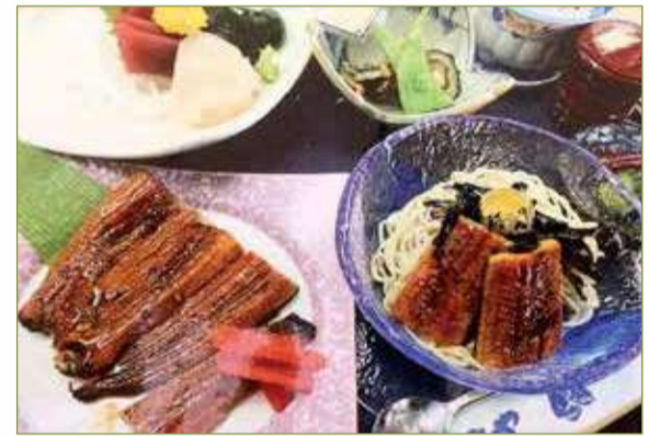
うなぎ 御膳 三,三〇〇円 ごはんのおかわり 無料