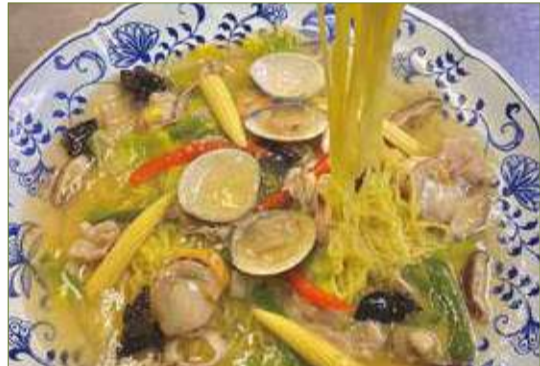
海鮮あんかけ塩ちゃんぽん 一、五〇〇円