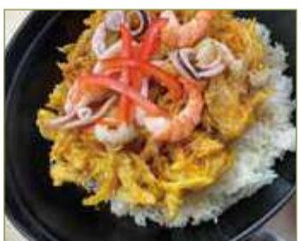
ジャンボかきあげ丼 一、五〇〇円