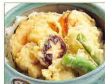
ホタテ天丼 一、六〇〇円