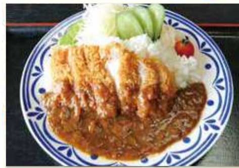
カツカレー 一七〇〇円 大盛り 一、九〇〇円

定食 刺身 身巻 一、三〇〇円 しょうが焼巻 一、六〇〇円 天ぷら巻 一、六〇〇円