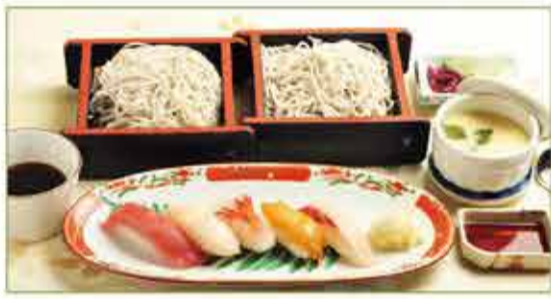
にぎわい膳 一,八〇〇円