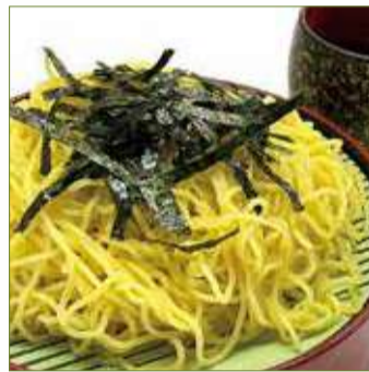
ざるラーメン 八〇〇円