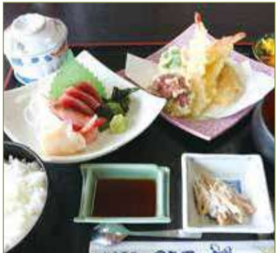
天ぷら刺身定食 二、三〇〇円