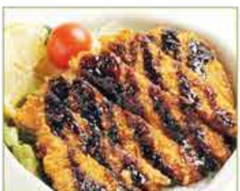
ソースかつ丼 一、四〇〇円

みいどんぶり 天丼 七〇〇円 鉄火丼 七〇〇円 いくら丼 七五〇円 サーモン丼 七〇〇円