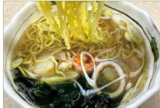
海鮮ラーメン 一、四〇〇円