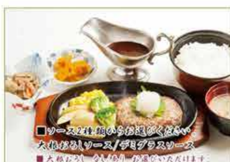
ハンバーグ 一六〇〇円