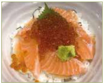
サーモンいくら丼 一、六〇〇円