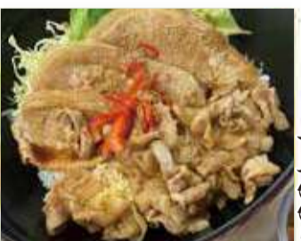
ジャンボ豚丼 一、七〇〇円