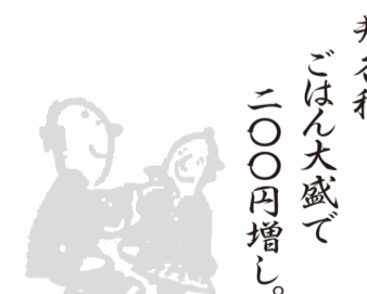
井各種 ごはん大盛で 二〇〇円増し。

みいどんぶり 天丼 七〇〇円 鉄火丼 七〇〇円 いくら丼 七五〇円 サーモン丼 七〇〇円